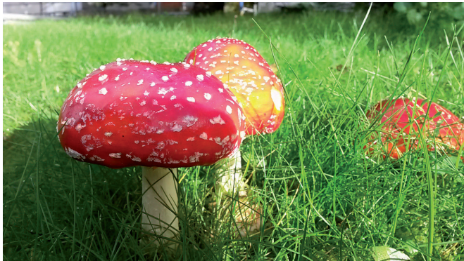
Flugsvamp, Amanita Muscaria .